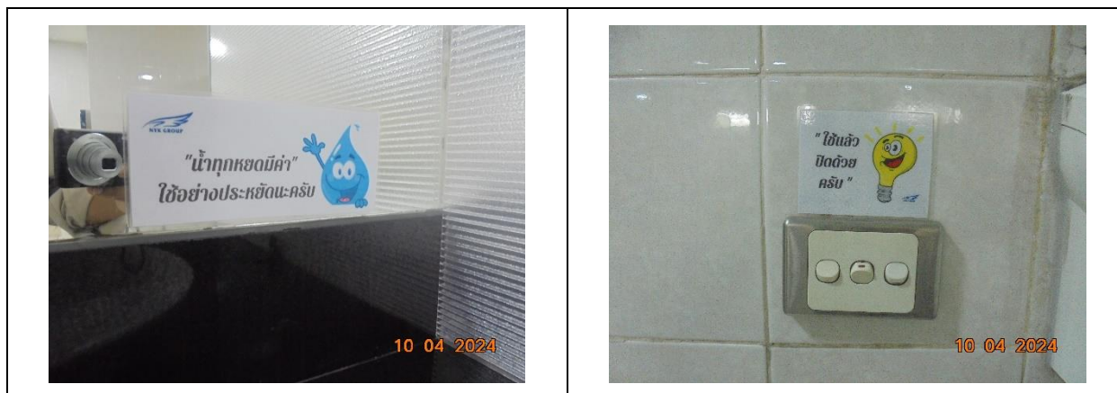
รูปที่ 9 ป้ายรณรงค์การใช้น้ำและพลังงานอย่างประหยัด