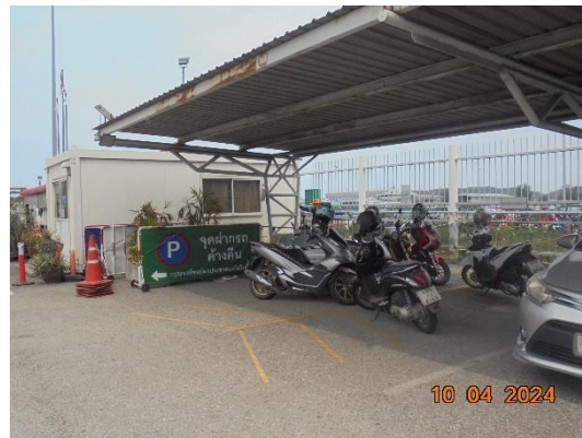
รูปที่ 1 ลานจอดรถภายในพื้นที่โครงการ