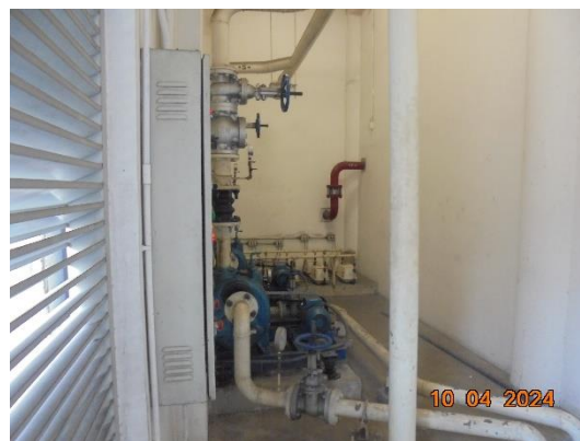
รูปที่ 2 ระบบบำบัดน้ำเสียและบ่อพักน้ำเสีย