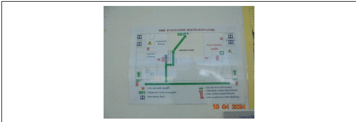
รูปที่ 14 แผนผังอุปกรณ์ดับเพลิง สัญญาณเตือนภัย และเส้นทางอพยพ กรณีเกิดอัคคีภัย