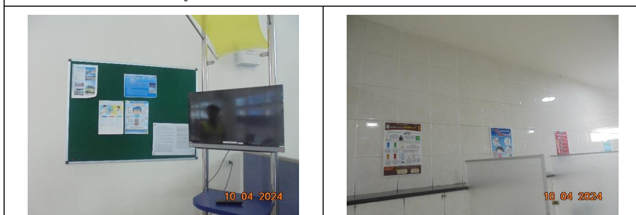
รูปที่ 11 ป้ายการเผยแพร่ความรู้ด้านสาธารณสุขและการป้องกันโรค