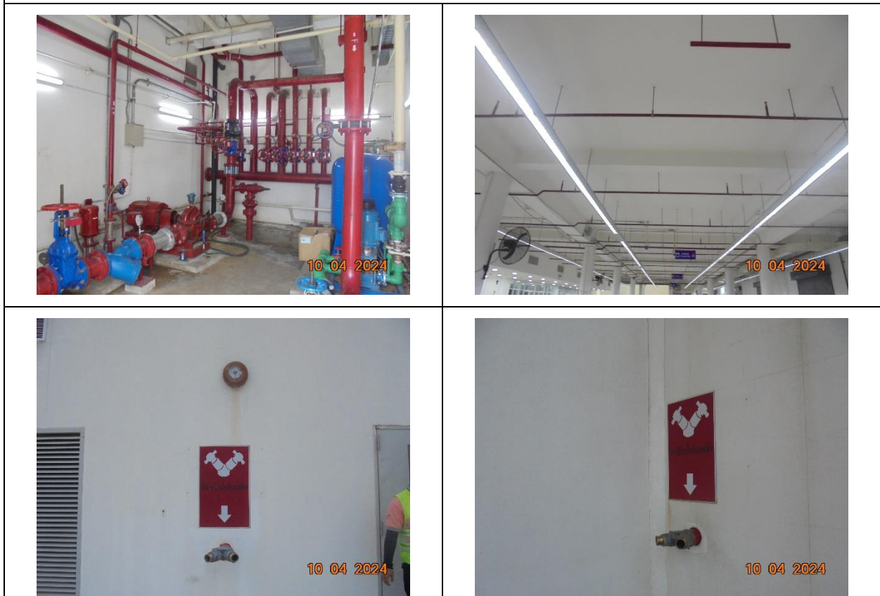
รูปที่ 15 ระบบท่อจ่ายน้ำดับเพลิง